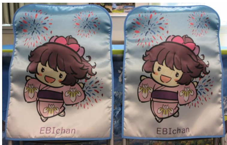
✪えびちゃん椅子カバー✪