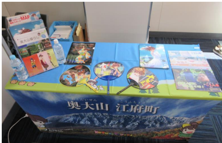
✪その他のグッズたち✪