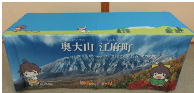
✪奥大山江府町テーブルクロス✪