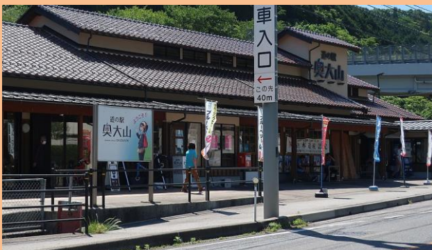
道の駅奥大山 物産館ぶなの森