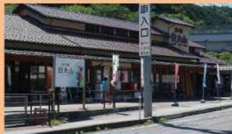
道の駅奥大山 物産館ぶなの森